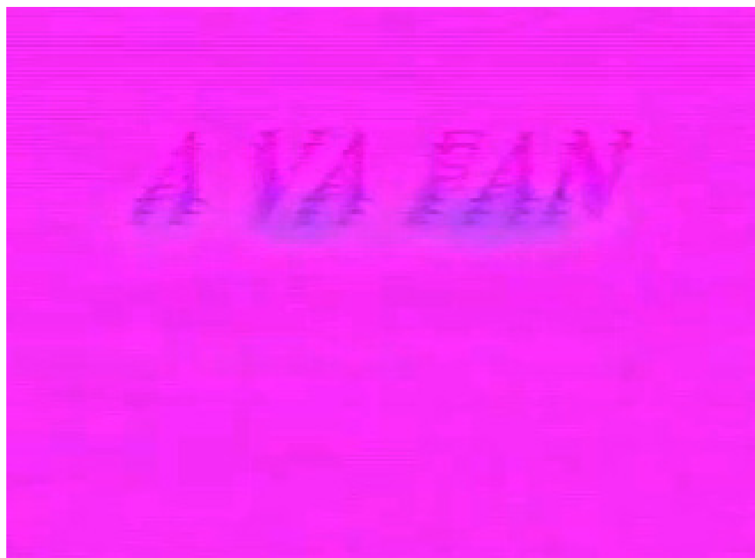
Stillbilder ur Nu ja, m fl

”A VA FAN” (i versaler); rosa bakgrund (eller videografisk färgstörning). Kvinna som röker i svartvit film. Blomma som blommar. Blomma som plockas. Textruta: ”jag ska bara köpa tidningen”; bild på okänt föremål; rosa färgfilter (eller videografisk färgstörning). Närbild på man som talar; grova videografiska störningar (flimmer, färger blöder, bilden rör sig upp och ned). Sekvens från attraktionsfilm(?) där ett tåg närmar sig en tunnel; rosa färgfilter (eller videografisk färgstörning). Två personer som dansar; rosa färgfilter (eller videografisk färgstörning). Sekvens från attraktionsfilm(?) där tåget åker in i tunneln; rosa färgfilter (eller videografisk färgstörning).